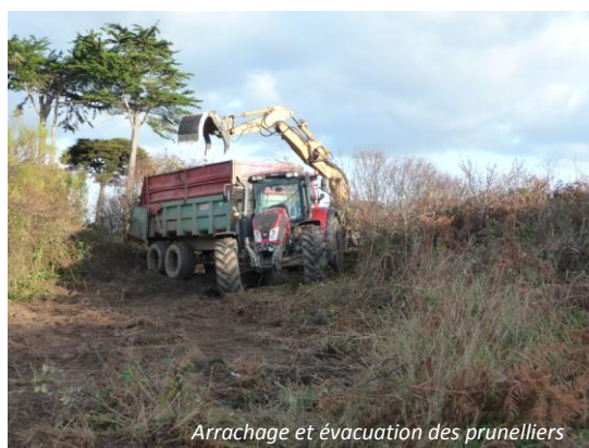
Arrachage et évacuation des prunelliers

Dans le cadre d'un contrat Natura 2000 signé par la commune de Pleumeur-Bodou, des travaux de lutte contre les prunelliers ont été réalisés. Ces travaux consistent à arracher et évacuer une partie des massifs de prunelliers afin de permettre la réinstallation des habitats dunaires caractéristiques. Ces travaux vont s'échelonner sur 2012 et 2013